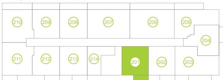
Půdorys podlaží / Floor plan