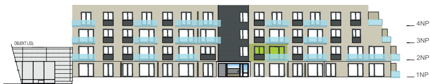
Východní pohled na dům / Building View - east side